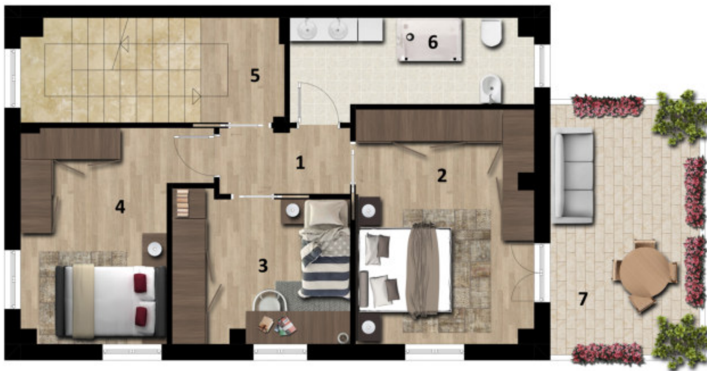
PLANIMETRIA PIANO PRIMO - STATO DI PROGETTO - H=2.70ML